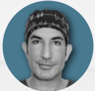
DR. MED. AFSCHIN FATEMI S-THETIC CLINIC DÜSSELDORF